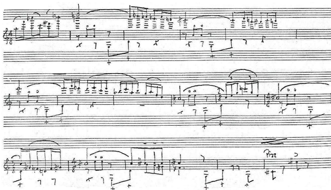
14. kottapélda: Balassa Sándor: Hegedűverseny, kadencia, 324. ütem

Rövid csúcspont után új zenei anyag, melodikus, kedélyes tánc indul a korábbról már ismert komor árnyalattal. Valami kimondatlan komoly érzelmű, indulat húzódik meg az alaphang háttérében. Drámáinak semmiképp nem nevezhető, viszont a szokásos finálék felszabadult öröme helyett Balassa kissé sötétebb, szinte groteszk karaktert választott. Grandiózus, energikus kadencia koronázza meg a tételt, ebben a hegedűtechnika arzenáljának számos eleme kap helyet, van pizzicato, bal kéz pizzicato, üveghangok, kettősfogások, akkordok. Balassa valószínűleg a versenymű keletkezésének fentebb kifejtett körülményei miatt nem alkalmaz újító megoldásokat, effektusokat, nem hallunk talpas pizzicatót, negyedhangokat. E tekintetben is konzervatív és hagyománytisztelő a szerző, ezáltal viszont zenéjének világos mondanivalója könnyen érthető, követhető. Kerül minden mesterkéltséget, olcsó megoldást, témáinak tartása van, komolyan kell venni. Néhány mozzanatban halvány utalások fedezhetők fel Bartók és Berg kadenciáinak elemeire: az indító d hangra épülő hármashangzat-felbontások arpeggio-alakban való megjelenése erős hasonlóságot mutat Bartók 2. hegedűversenye kadenciájának indulásával. Szintén rokon megoldás a Berg-versenymű kadenciájának jellegzetes polifon, arco–pizzicato motívuma a Balassa-féle hosszú tartott hang alatti, illetve feletti üres húrok egyenletes megszólaltatása bal kéz pizzicatóval.