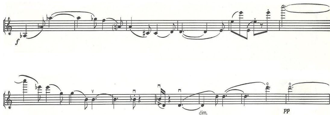
35. kottapélda: Sárközy István: Hegedűverseny I. tétel, 59. ütem

A zeneszerző alaposan kihasználja a hegedű technikai lehetőségeit, már a bevezető Preludióban szép számban szerepelnek üveghangok, kettősfogások, trillák, éppúgy, mint arpeggiós felbontású pizzicatók. Az arco és pizzicato játékmód változatossá teszi a hangzásképet, akárcsak a helyyel-közzel használt glissandók. A többnyire szűkjáratú dallamvezetést jólesően ellensúlyozzák helyenként a nagy hangközugrások, melyek tiszta megszólaltatása igen komoly kihívást jelent az előadó számára.