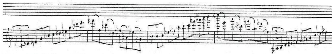
12. kottapélda: Balassa Sándor: Hegedűverseny I. tétel, 130. ütem

jellegű közjáték következik. Az igazi kontraszt a melléktéma Meno mosso Moderato tempójelzésű epizódja, ez a kupolás szerkezetű 12 ütemes nagy zenei mondat először a zenekaron szólal meg. Ebben Kodály világa elevenedik fel, kvárt-, kvint- és szextpárhuzamok gazdagítják a magyar koloritot. Ezt követi a szólista és a tutti közötti dialóguson alapuló játékos, koncertáló szakasz, melyben egyre virtuózan száguldozik a hegedű, hangterjedelmének teljes szélességében. Bartóki utalást hallunk a 130. ütemben: a kis szext nyolcadmozgás nem csak ritmikájában, hanem a kíséretében is emlékeztet a 2. hegedűversenyből ismerős szakaszra.